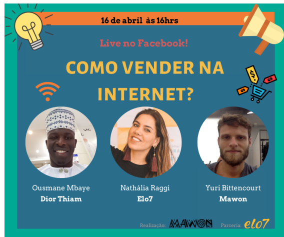
Workshop Venda Online (16/04)