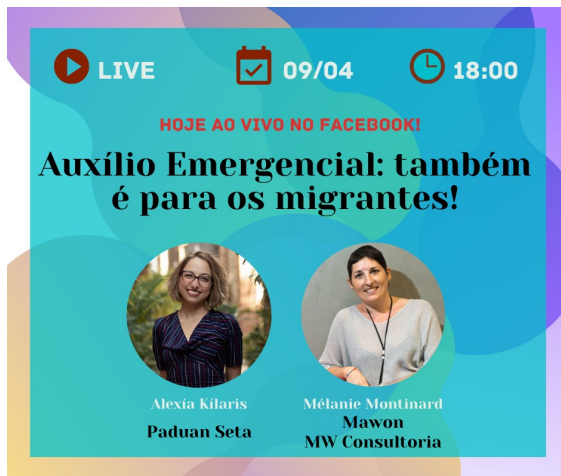
Live sobre Auxílio Emergencial (8/4)