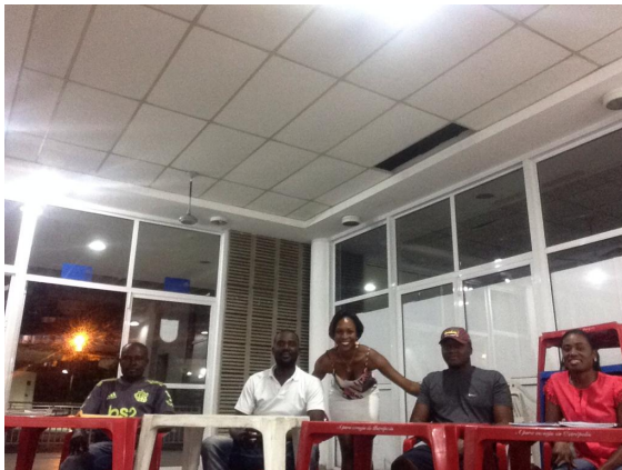
Aula na Central (11/03)