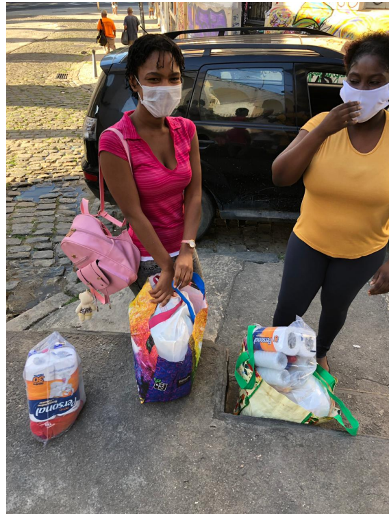
Doações para beneficiários do Projeto